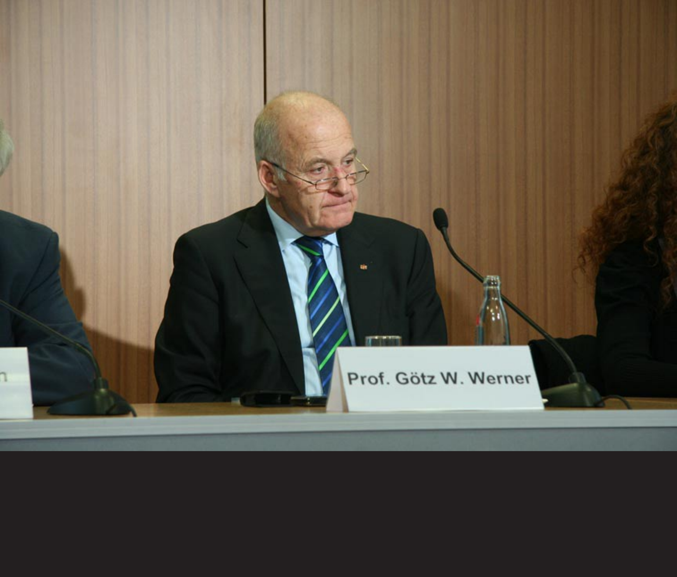
Prof. Götz W. Werner