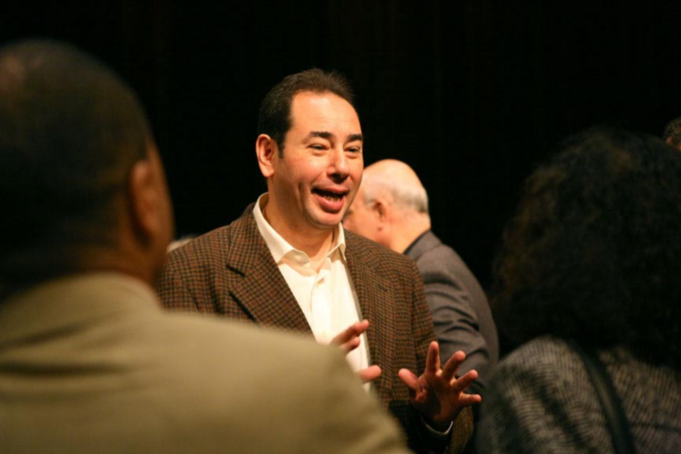
Chalid Al-Chamissi (Autor „Im Taxi. Unterwegs in Kairo“. 2011)