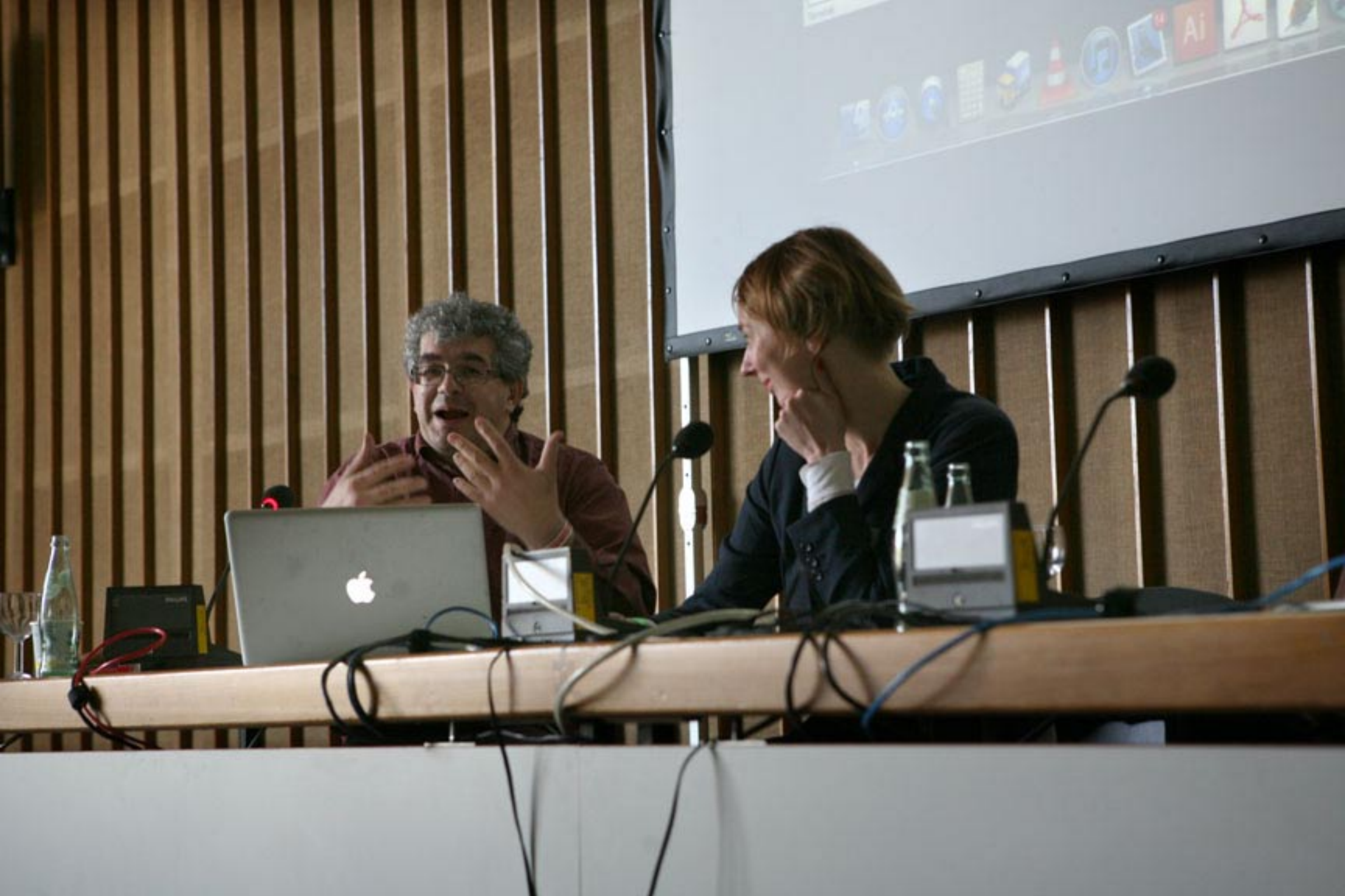
Philippe Rekacewicz Kartengraphik Le Monde Diplomatique. Doris Akrap - Taz