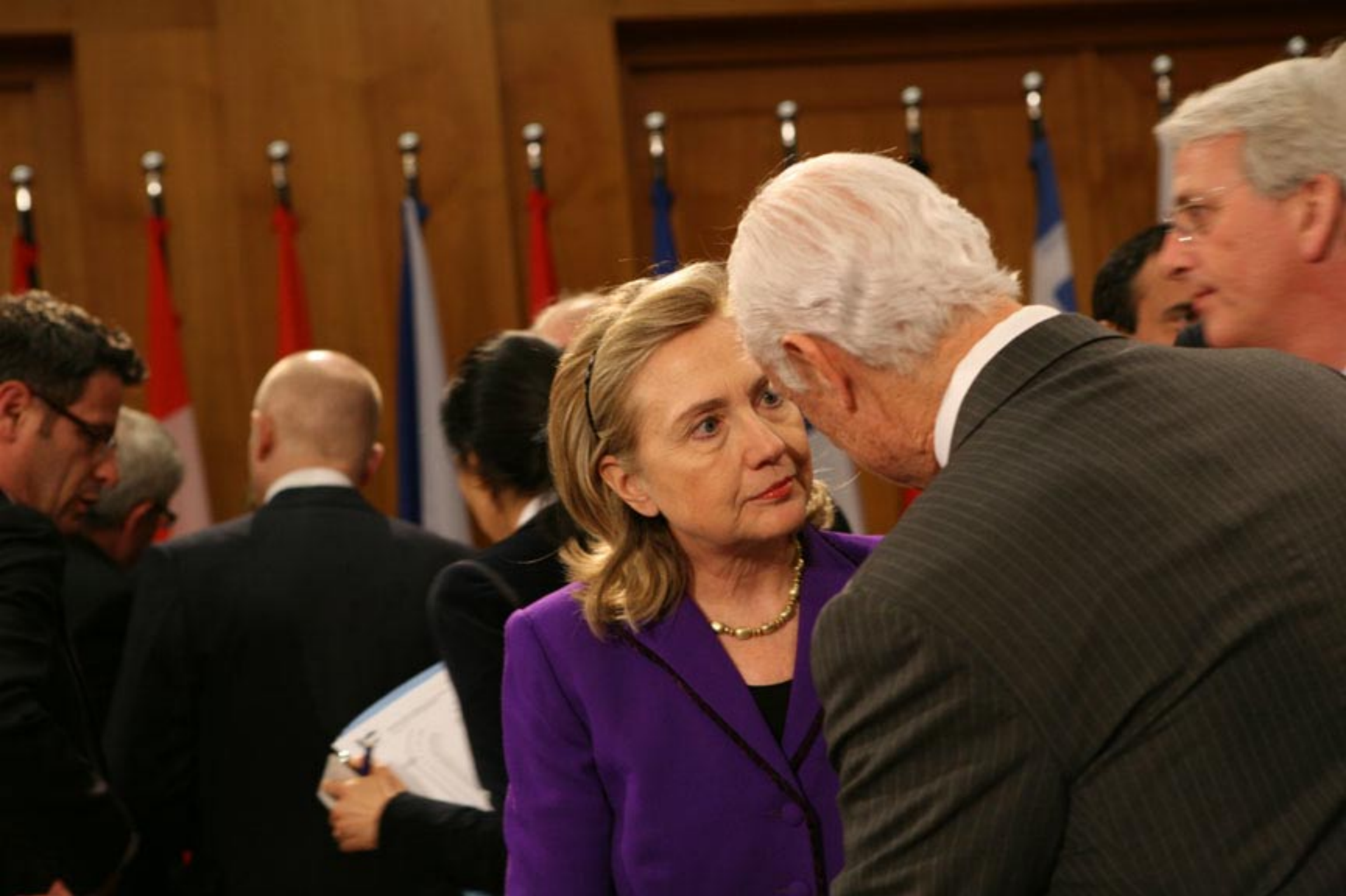
Hillary Clinton und Staffan di Mistura UNAMA-Special Representative of the Secretary General in Afghanistan