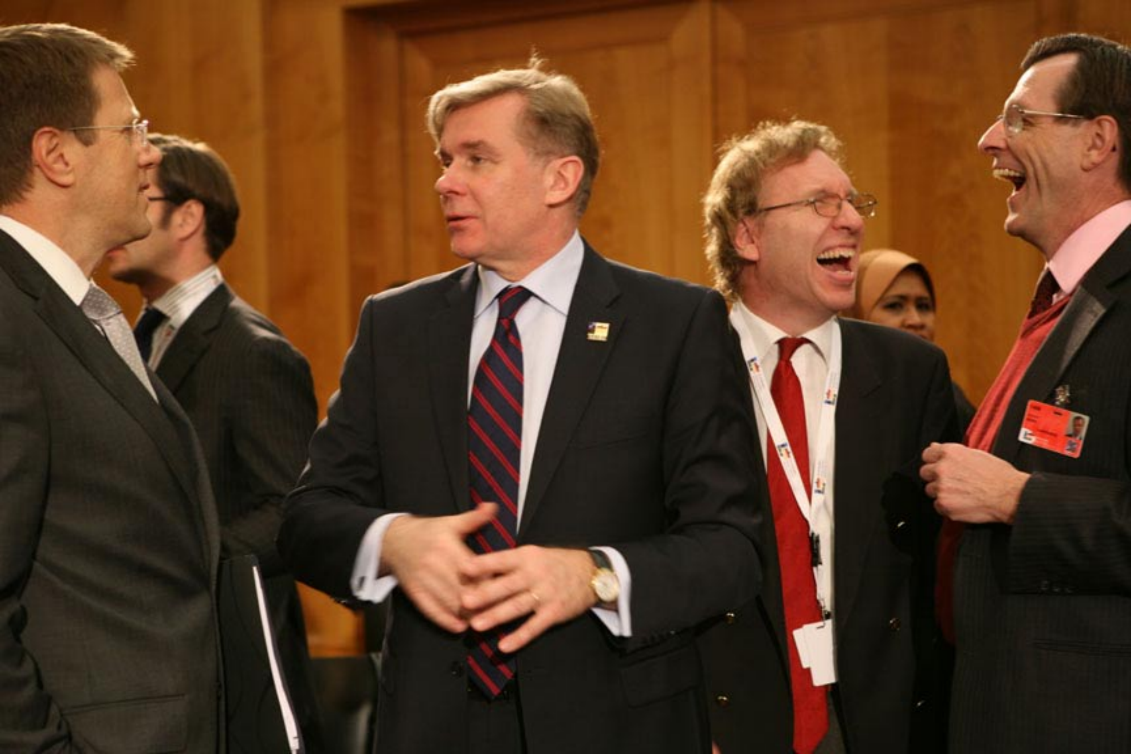
Mitte Audronius Azubalis, Außenminister von Litauen rechts Delegationsmitglied von Luxemburg