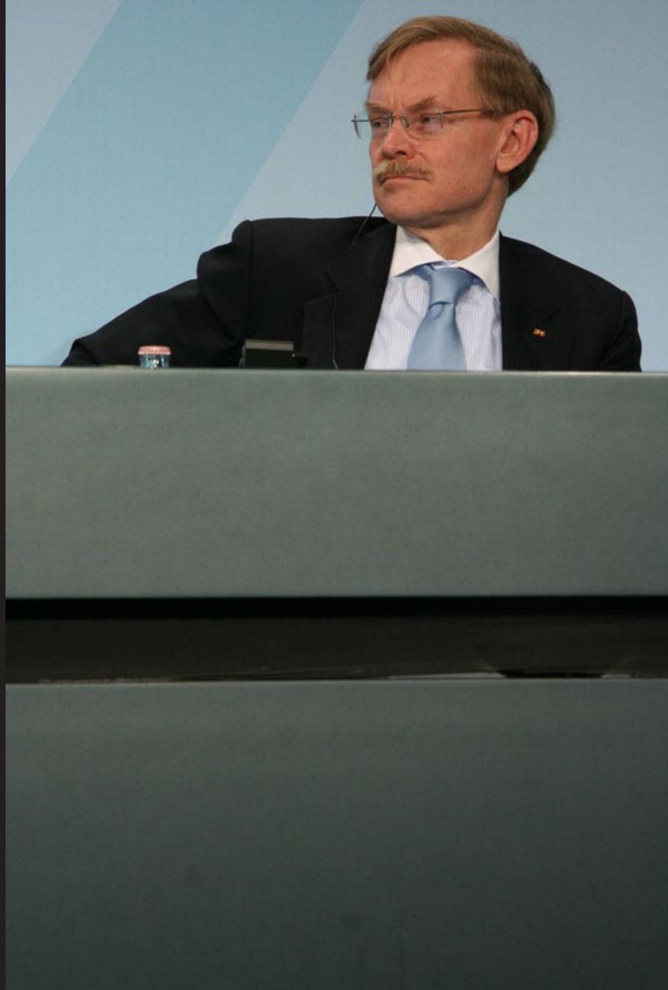
Weltbankpräsident Robert B. Zoellick