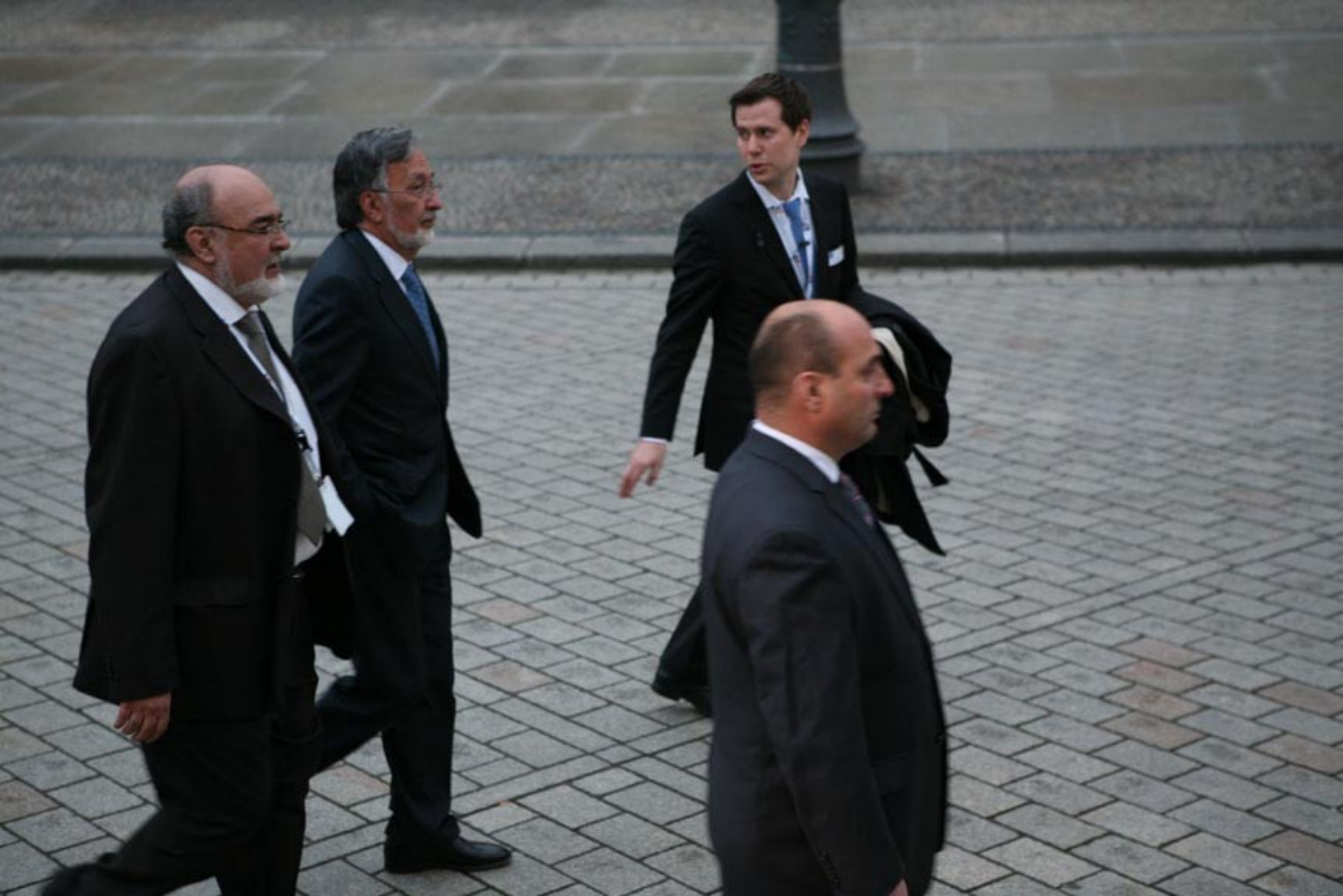
zweiter von links: Zalmay Rassoul. Außenminister von Afghanistan