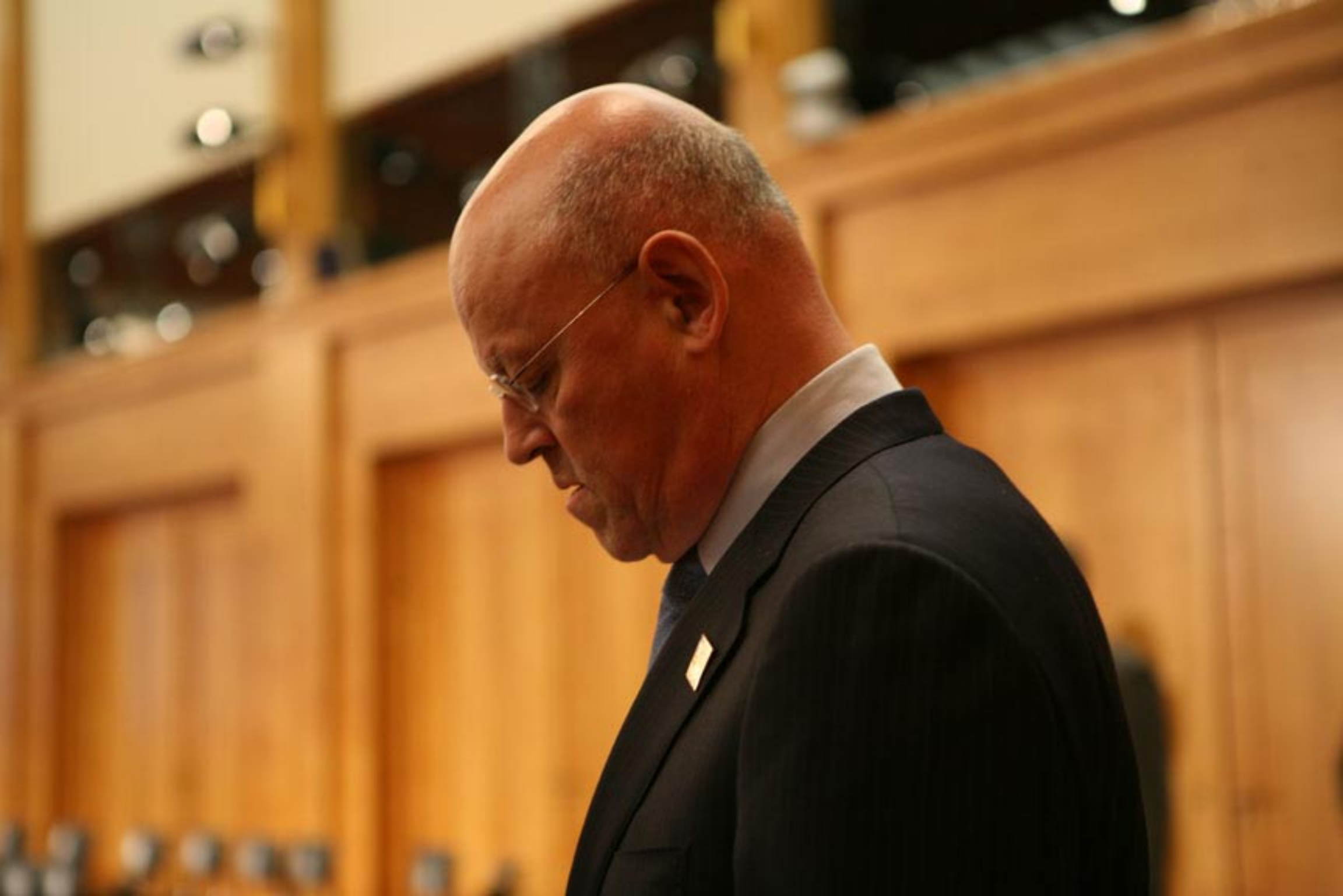
Uri Rosenthal - Außenminister der Niederlande