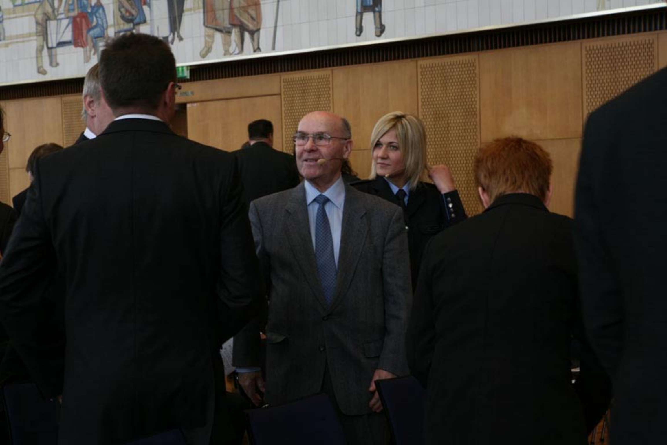
pensionierter BGS Beamter und Anwärtlerin vor ihrem Auftritt