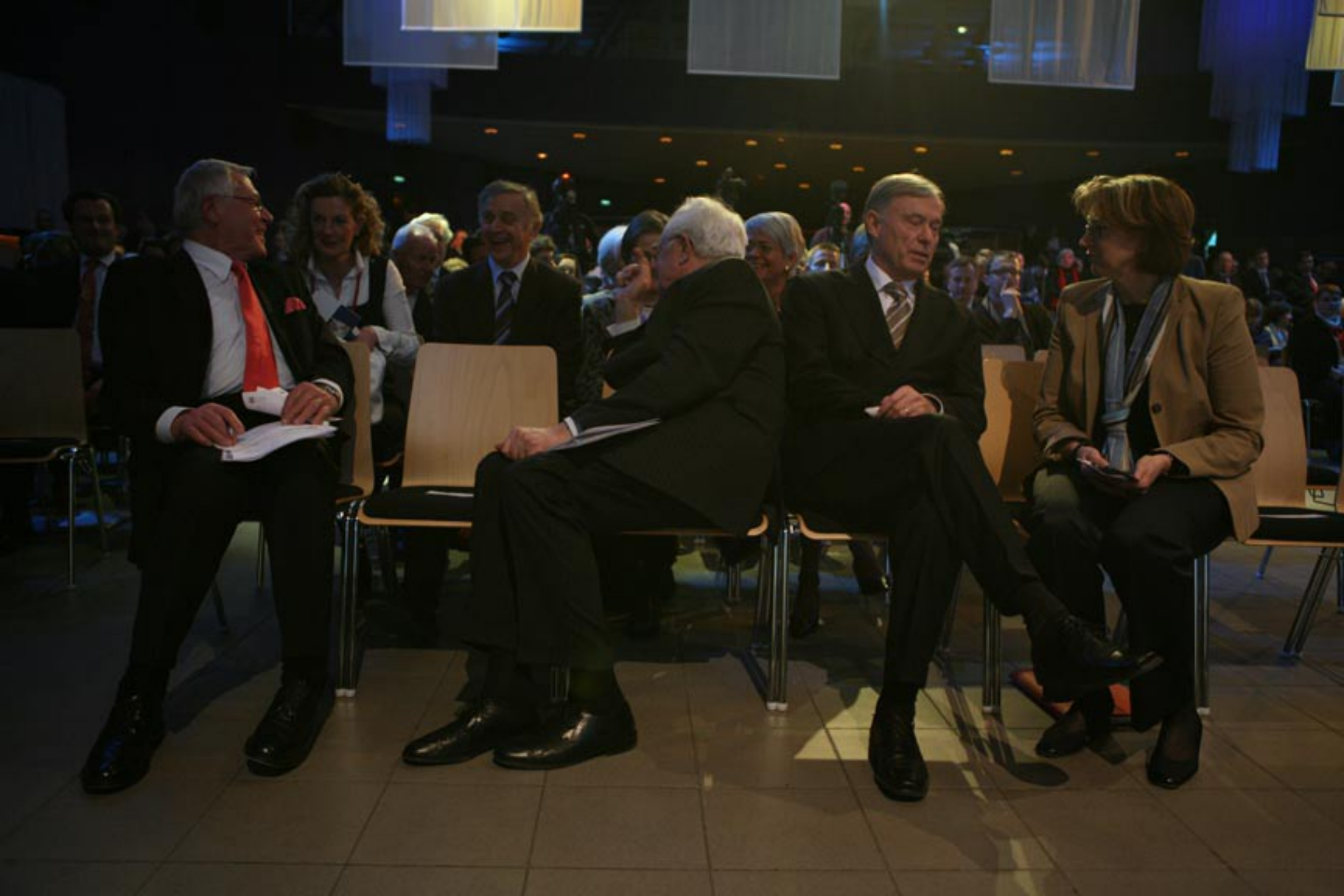
vlnr: Theo Sommer Chefredakteur "Die Zeit" a.D., Bernhardt Vogel, Horst Köhler