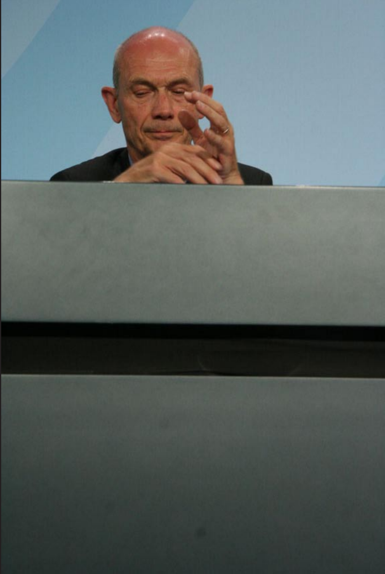
WTO-Generaldirektor Pascal Lamy