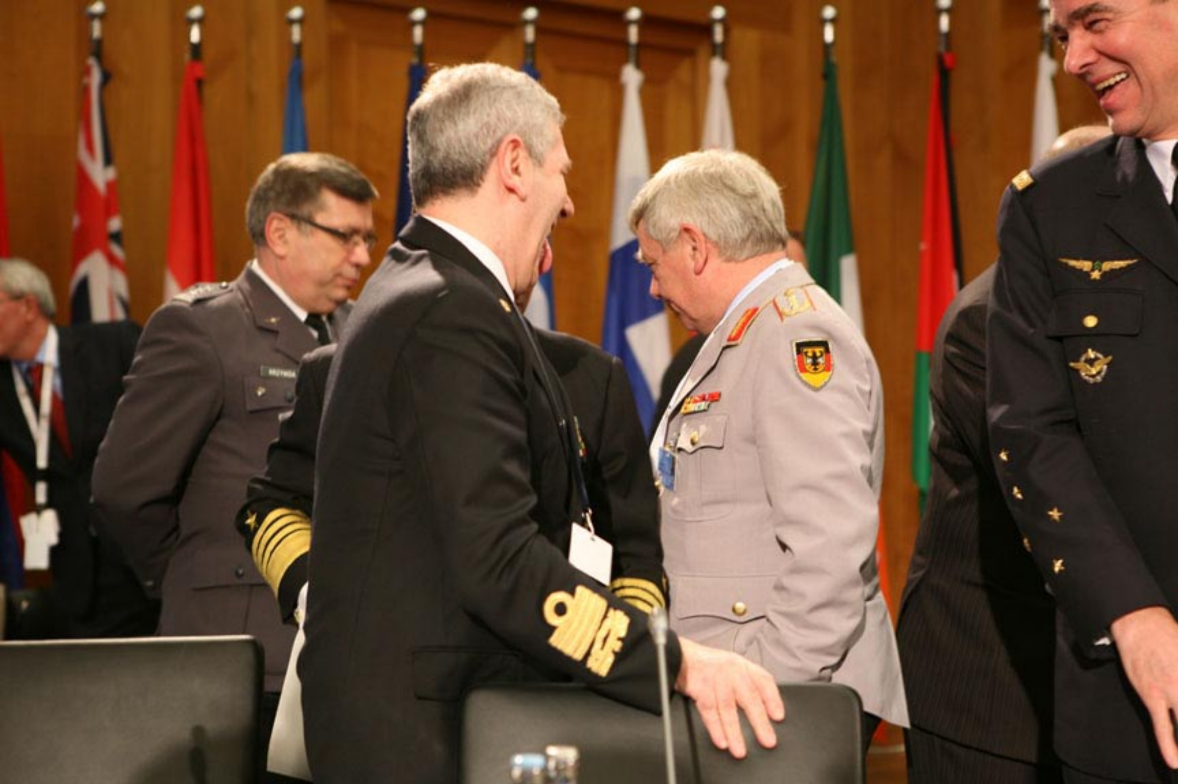
links Admiral Giampaolo Di Paola, Vorsitzender des NATO-Militärausschusses CMC, rechts General Stephane Abrial, SACT-Supreme Allied Commander Transformation (Abt. für Zukunft und Neuorientierung der Nato)