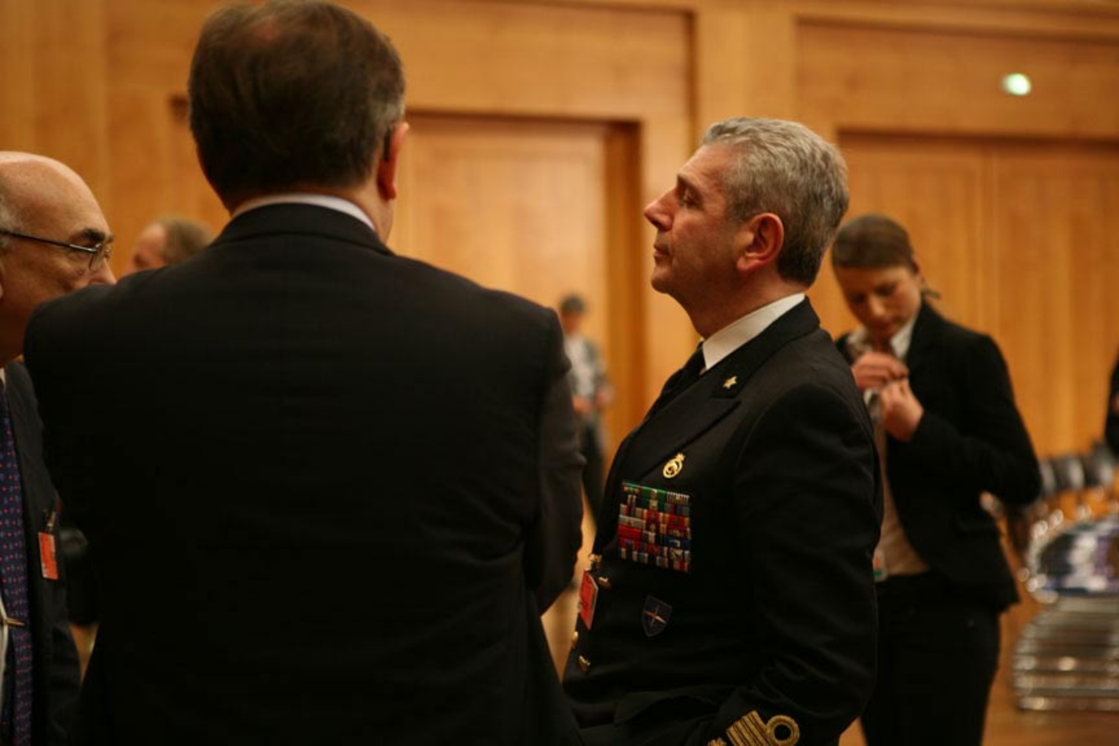
Admiral Giampaolo Di Paola. Vorsitzender des NATO-Militärausschusses CMC