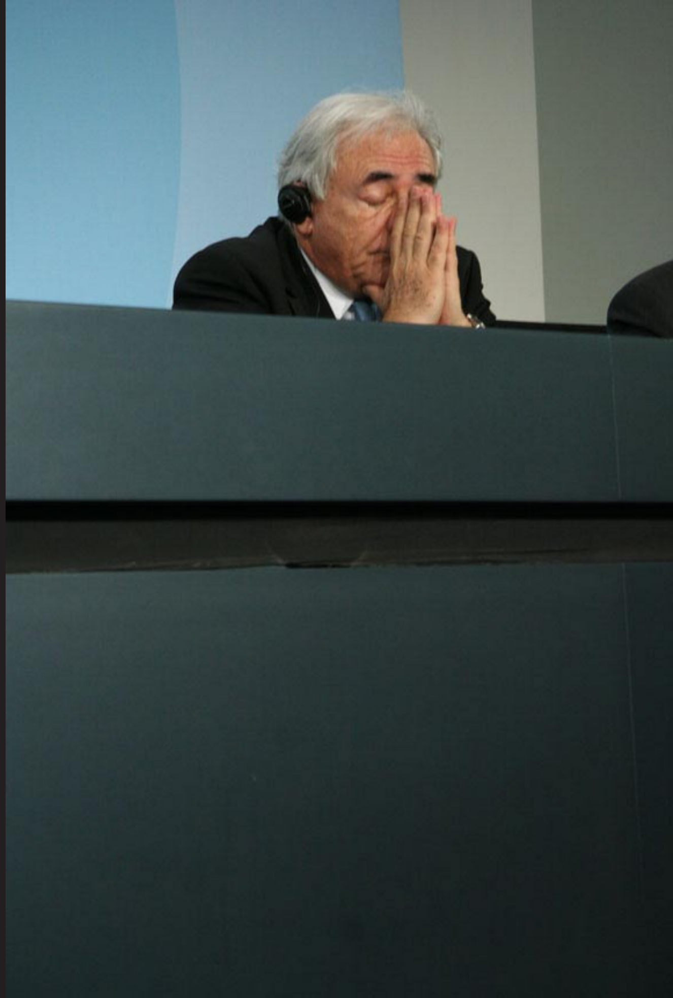
Geschäftsführender Direktor des IWF Dominique Strauss-Kahn